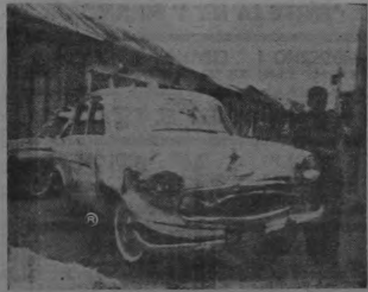
ESPECTACULAR COLISION. En Avenida 6ª, Calle 4ª, se produjo violento estrellonazo, a consecuencia del cual quedó arruinado este llamante coche deportivo. Pese a lo violento del choque, no hubo daños personales..