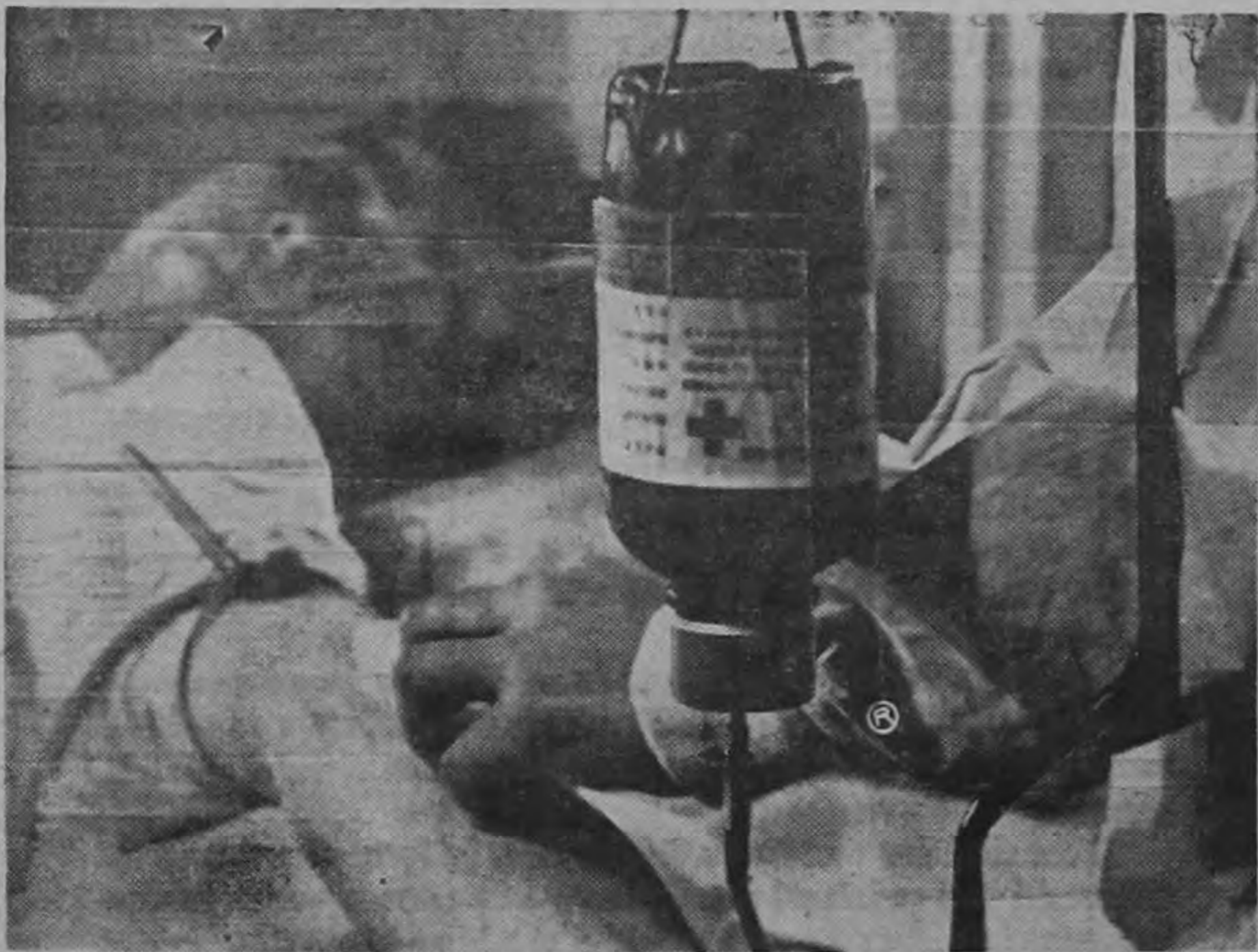
EN TODAS LAS REGIONES DEL MUNDO salvan vidas los servicios de transfusión sanguínea de la Cruz Roja. (La sangre suministrada por la Cruz Roja japonesa acelerará la curación de este caso de urgencia).