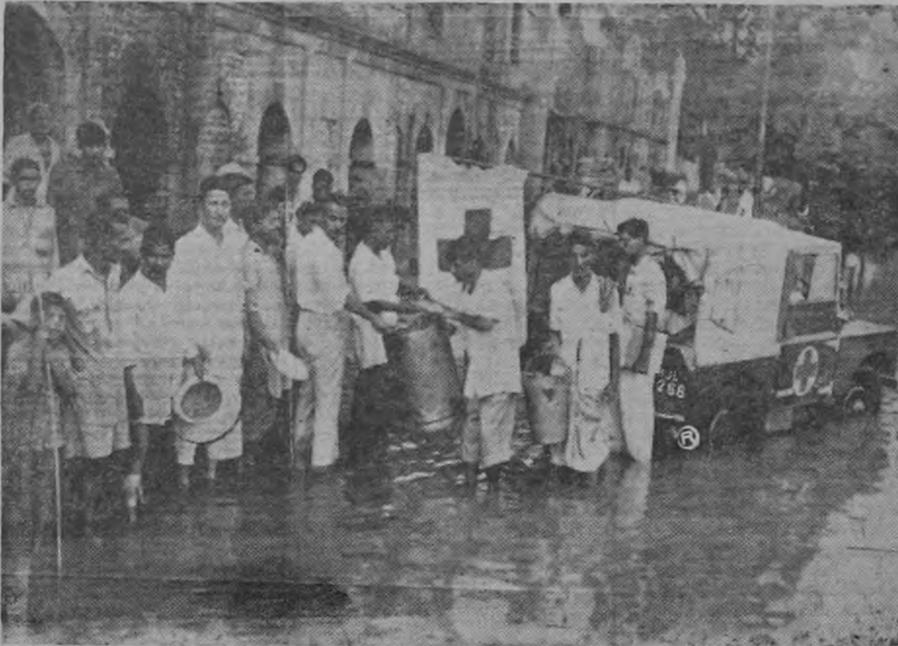
LA CRUZ ROJA EN ACCION entre las víctimas de un desastre nacional. En la gráfica se ve a miembros de la Cruz Roja pakistaní distribuyendo comidas calientes entre las víctimas de una inundación.

¿SABE USTED QUE en la India, el 25% de los centros de protección maternal e infantil están administrados por la Sociedad de la Cruz Roja, o están afiliados a ella?